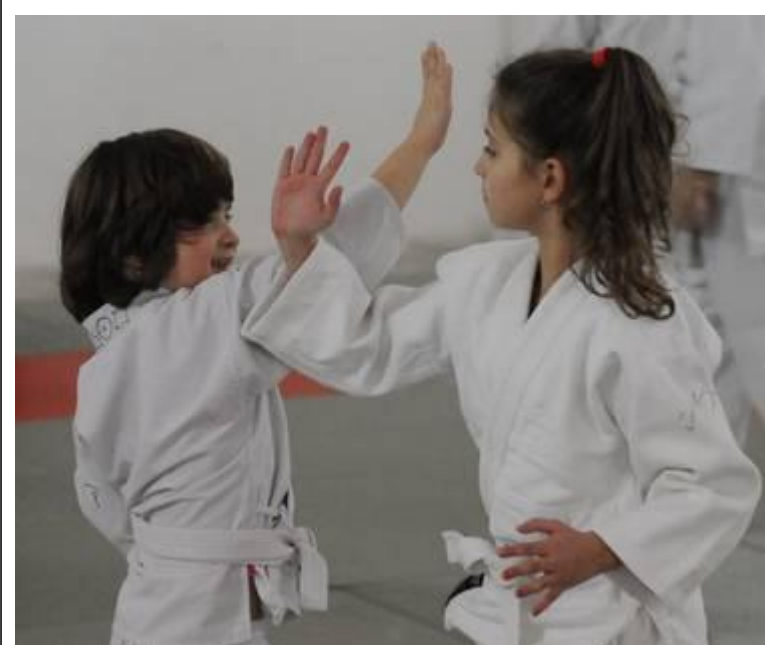
Copii practicanti AIKIDO

" Adevarata victorie este victoria asupra sinelui "